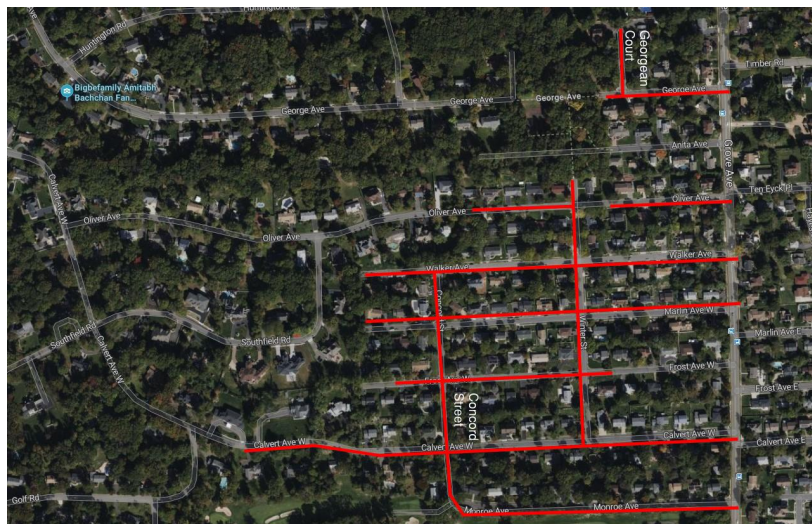
Mapa del proyecto, calles afectadas resaltadas en rojo (arriba)