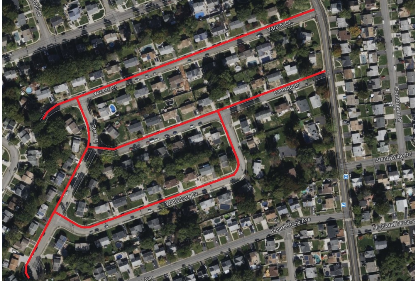
Project map, affected streets highlighted in red (above)