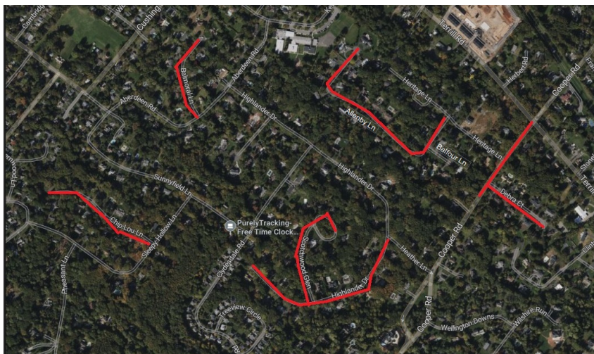
Project map, affected streets highlighted in red (above)