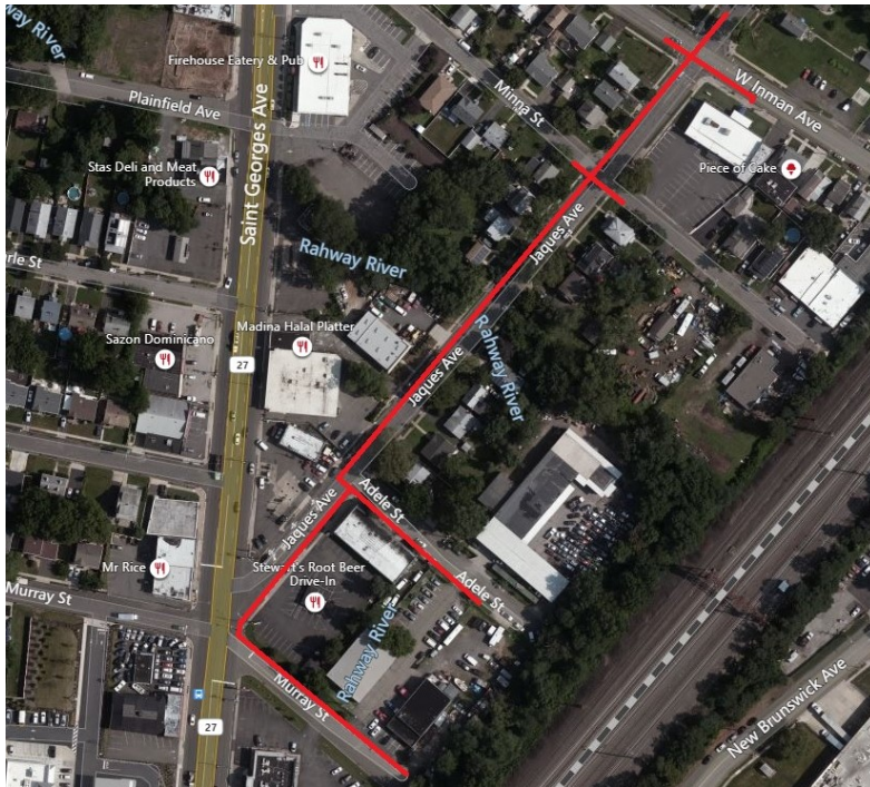
Project map, affected streets highlighted in red (above)