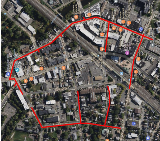
Project map, affected streets highlighted in red (above)