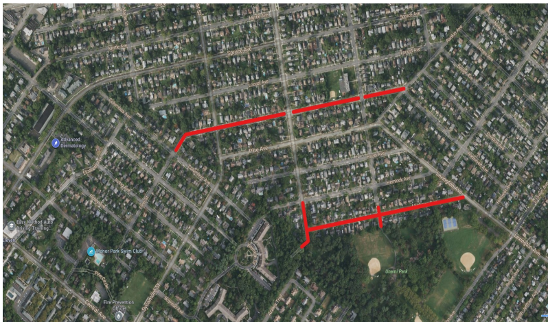
Mapa del proyecto, calles afectadas resaltadas en rojo (arriba)