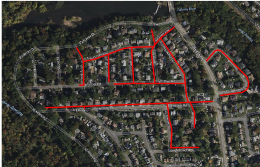
Project map, affected streets highlighted in red (above)