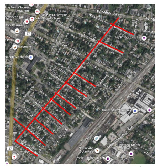
Project map, affected streets highlighted in red (above)