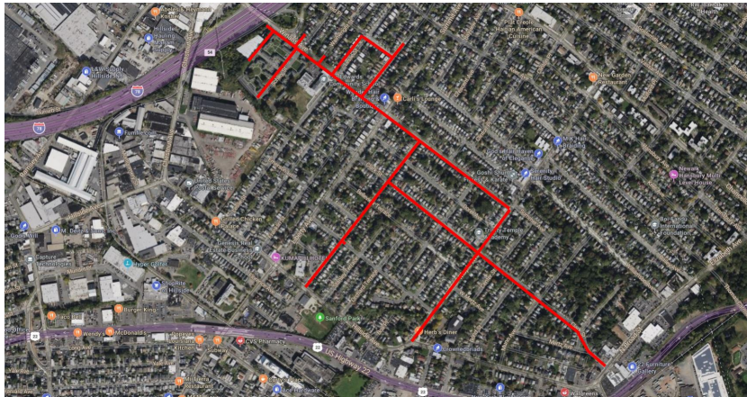
Project map, affected streets highlighted in red (above)